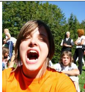
Povzeto po: B. Žorž, Pisma mojim mladim prijateljem

Torej: prepusti se svoji radovednosti, bodi radoveden, preveri, izkusi – in potem presodi! Pa lepe počitnice ti želim!